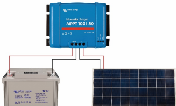
Figure 1: Power connections